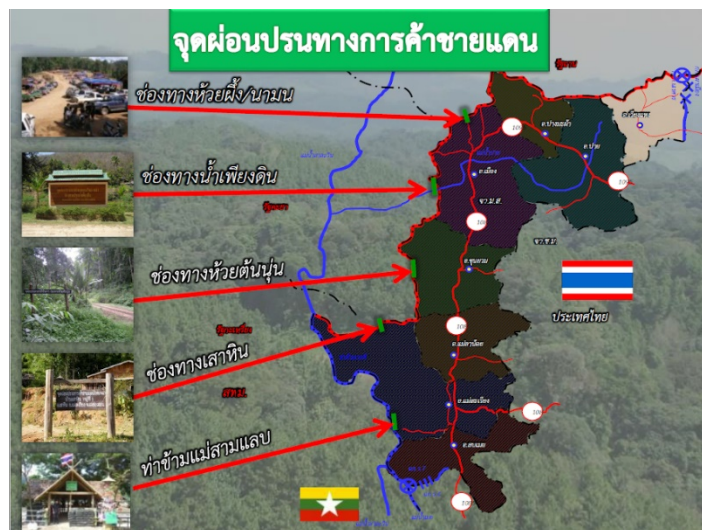
ภาพที่ 1 แสดงสถานที่ตั้งจุดผ่อนปรนจุดต่างๆ ในจังหวัดแม่ฮ่องสอน

จากการศึกษาจุดผ่อนปรนการค้าชายแดนของจังหวัดแม่ฮ่องสอน จำนวน 5 จุดซึ่งมีการกระจายตัวของจุดผ่อนปรนประกอบด้วยพื้นที่ในอำเภอเมือง อำเภอขุนยวม อำเภอแม่สะเรียง และอำเภอสบเมยตามลำดับพบว่า สภาพแวดล้อมและสภาพการณ์ของจุดผ่อนปรนต่างๆ ช่วงวิกฤติโควิด-19 ก็ยังคงมีการค้าขายกันตามปกติเพียงแต่ระงับการเดินทางเข้าออกของบุคคล ยานพาหนะ และสิ่งของ แต่ให้ดำเนินการได้เฉพาะการนำเข้า-ส่งออกสินค้า โดยให้ขนถ่ายสินค้าบริเวณจุดผ่อนปรนที่กำหนดเท่านั้น ยังไม่อนุญาตให้มีการข้ามแดนของบุคคลและยานพาหนะ และให้มีการปฏิบัติตามมาตรการในการควบคุมการแพร่ระบาดของโรคติดเชื้อโควิด-19 อย่างเคร่งครัด ภายหลังจากที่รัฐบาลไทยประกาศเปิดประเทศและจังหวัดแม่ฮ่องสอนเปิดจุดผ่อนปรนเชื่อมเมียนมาตลอดแนวชายแดนแม่ฮ่องสอน การค้าเริ่มกลับสู่สภาพปกติแต่สภาพเศรษฐกิจยังคงซบเซาด้วยสาเหตุอื่นๆ ภายหลังรัฐประหารในเมียนมา ซึ่งผลกระทบส่วนใหญ่เกิดจากการผันผวนของค่าเงิน จึงทำให้กำลังซื้อของทางฝั่งเมียนมาลดลง โดยแต่ละด่านบริบททางด้านเศรษฐกิจที่คล้ายคลึงกันตามที่ได้กล่าวไปข้างต้น แต่มีสภาพการณ์และองค์ประกอบทางการค้าที่แตกต่างกันดังรายละเอียดต่อไปนี้