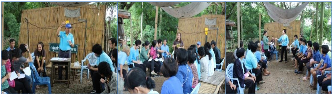
ภาพที่ 3 การประชุมสมาชิกกลุ่มฯ เพื่อสร้างข้อกำหนดของ “ธรรมนูญ” และทำการจัดสรรรายได้จากการจำหน่ายพืชผักอินทรีย์

รักษาวินัยของชุมชน สามารถช่วยเหลือชุมชนให้มีคุณภาพชีวิตที่ดีมากขึ้น ด้วยการมีทั้งรายได้หลักและรายได้เสริมจากการจัดจำหน่ายพืชผักเกษตรอินทรีย์ที่ปลูกเองในครอบครัว/เครือข่ายหรือแปลงผักรวมที่กลุ่มฯ จัดทำให้จนทำให้มีเงินทุนหมุนเวียนภายในกลุ่มฯ ประมาณ 500,000 บาท/ปี โดยคณะกรรมการมีจัดแบ่งเป็นเงินทุนหมุนเวียนภายในกลุ่มฯ จำนวน 150,000 บาท และให้สมาชิกกู้ยืมประมาณ 350,000 บาท โดยคิดอัตราดอกเบี้ยร้อยละ 10 ต่อปี สามารถลดเงินต้นและลดดอกเบี้ยควบคู่กันไป เพื่อแก้ปัญหาความยากจนให้กับสมาชิกวิสาหกิจชุมชน ผ่านการวิเคราะห์ปัญหา ความต้องการและหาแนวทางในการแก้ไขปัญหาได้ถูกวิธี ส่งผลทำให้ชุมชนมีเงินทุนหมุนเวียนระดับฐานราก ยกกระดับความเป็นอยู่ของชุมชนให้ดีขึ้นกว่าเดิม ผ่านกิจกรรม/โครงการของกลุ่มวิสาหกิจชุมชนให้เกิดความเข้มแข็ง ดังภาพที่ 3 การประชุมสมาชิกกลุ่มฯ เพื่อจัดสรรรายได้จากการจำหน่ายพืชผักอินทรีย์