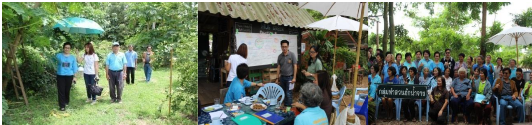
ภาพที่ 5 กิจกรรมเยี่ยมชมแปลงผักอินทรีย์ การเสวนากลุ่มและการถอดองค์ความรู้ ของกลุ่มวิสาหกิจชุมชนผ่านบทบาทของธรรมนูญ